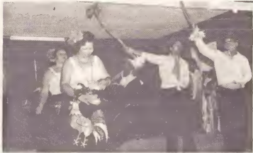
Un presentacion tipico folklorico a ser duna na stadion pa e grupo "San Juan" durante e anochi cultural na stadion.